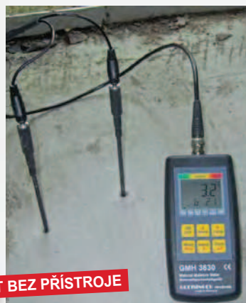
SET BEZ PŘÍSTROJE