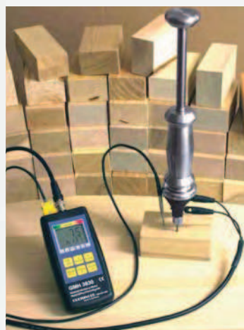
SET BEZ PŘÍSTROJE